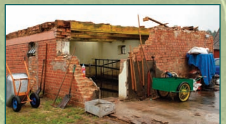
Najwięcej czasu i pieniędzy potrzeba na odbudowanie zniszczonych budynków gospodarskich.