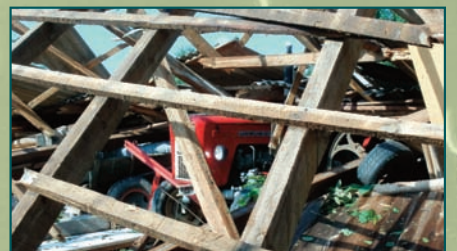
Niektórzy rolnicy muszą odtworzyć dorobek całego życia.