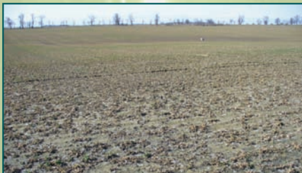
W tym roku, po mroźnej zimie, wiele pól trzeba było wiosną obsiać ponownie.

Od 15 października do 26 listopada 2012 roku rolnicy, których gospodarstwa poważnie ucierpiały wskutek klęsk żywiołowych, mogą ubiegać się o przyznanie pomocy finansowej na odbudowę produkcji. Udzielana jest ona z działania „Przywracanie potencjału produkcji rolnej zniszczonego w wyniku wystąpienia klęsk żywiołowych oraz wprowadzenie odpowiednich działań zapobiegawczych”, należącego do Programu Rozwoju Obszarów Wiejskich na lata 2007 – 2013. Mogą z niego skorzystać m.in. poszkodowani przez powodzie, osunięcia ziemi, mroź i wiosenne przymrozki, nawałnice, grad, huragany czy uderzenie pioruna.