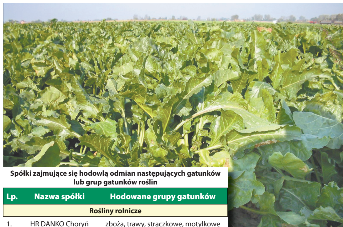
Spółki zajmujące się hodowlą odmian następujących gatunków lub grup gatunków roślin