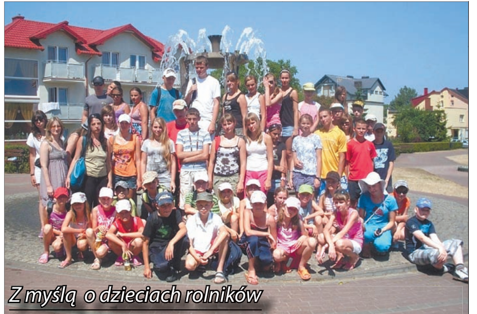
Z myślą o dzieciach rolników

Koloniści nie mieli okazji się nudzić, ponieważ w Jastrzębiej Górze, Władysławowie i Zakopanem czekało na nich wiele atrakcji. Organizatorzy zadbałi bowiem nie tylko o opiekującą się nimi fachową kadrę pedagogiczną, ale również