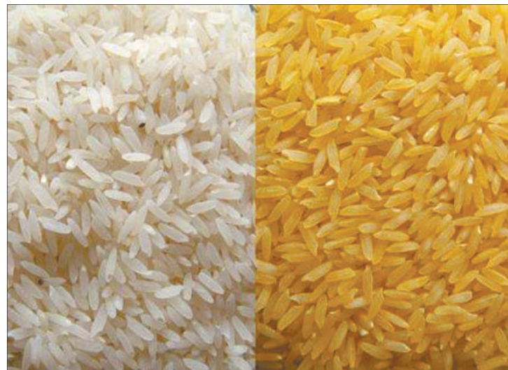
Po lewej stronie tradycyjna odmiana ryżu, po prawej – genetycznie zmodyfikowany „złoty ryż” charakteryzujący się podwyższoną zawartością \beta -karotenu (prekursora witaminy A)

Klasyczne uprawne odmiany ryżu, pomimo dużej wartości odżywczej, zawierały znikomą ilość witaminy A, niezbędnej do prawidłowego funkcjonowania wzroku. Stąd dużym osiągnięciem było wytworzenie w 2000 roku genetycznie zmodyfikowanego ryżu, z