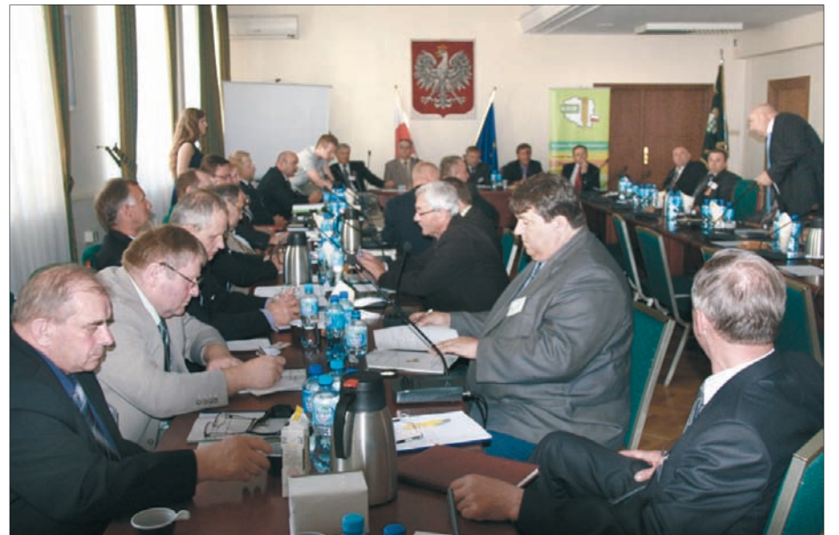
Posiedzenie Rady IV kadencji

W trakcie obrad prezesi i delegaci tworzący KRIR wybrali również Komisję Rewi-