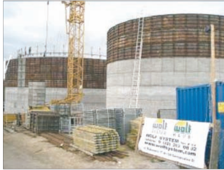
Monolityczne zbiorniki żelbetowe Wolf System są gwarancją stabilnej i szczelnej konstrukcji

Warto także podkreślić, że firma Wolf System buduje monolityczne, cylindryczne zbiorniki dla oczyszczalni ścieków, począwszy od stacji pomp, poprzez zbiorniki na wody opadowe, aż do oczyszczalni ścieków dla dużych obszarów. Zgromadzone dotychczas praktycz-