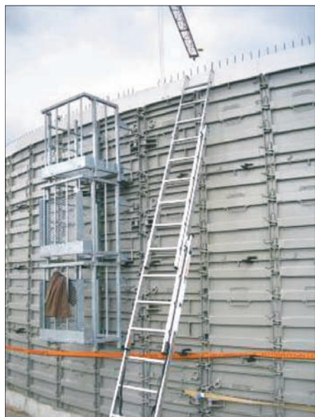
System szalunków Wolf System nie posiada kotew skrętnych, dzięki czemu zbiorniki żelbetowe są maksymalnie szczelne

Popularność zbiorników sygnowanych marką Wolf System w dużym stopniu opiera się na opatentowanym i wyprodukowanym przez tę firmę stalowym szalunku dla zbiorników cylindrycznych. Perfekcyjnie przygotowany system usztywniający gwarantuje dokładne i idealnie okrągłe formy zbiorników. Szalunki wewnętrzne i zewnętrzne są tak skonstruowane, by mogły być montowane bez kotew ściennych i elementów dystan-