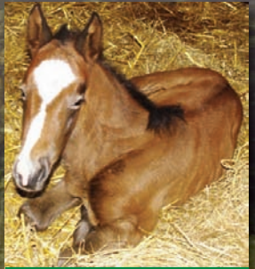
Takie piękne żrebaki rasy śląskiej przychodzą na świat dzięki Programowi Rolnośrodkowemu.